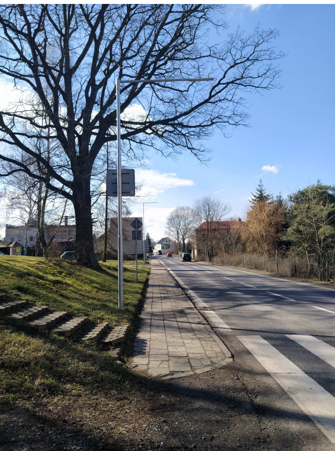
Pohled ze směru Liberec